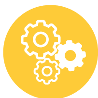
ANTOLAKETA ETA FUNZIONAMENDUA

Lehenengoan, hasteko, parte-hartzaileen abiapuntua ezagutu genuen, gaiari buruz, eta kudeaketa-ereduari buruzko kontu adierazgarriak identifikatu genituen. Bigarrean, guztion artean definitu genuen kudeaketari buruz etorkizunean nolako zentroa nahi dugun, eta zer baliok sostengatu duten. Hirugarrena kudeaketari dagozkion alderdi zehatzen inguruko sakontze-lana egin zen. Bertan landu eta sakondu ziren alderdiak aldeztatik prestakuntza-jardunaldietan kudeaketarako ardatz moduan identifikaturiko horiek berak izan ziren: